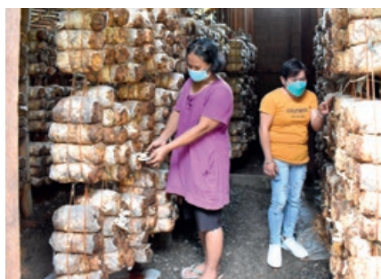
Vertikale Pilzzucht in Hütten auf den Philippinen.

Seit 2019 arbeiten die Johanniter mit ihrem Partner HIPPE auf den Philippinen zusammen. Vor allem arme Familien werden bei der Anpassung an den Klimawandel unterstützt. Dank alternativer Maßnahmen nutzen heute rund 1.600 Familien ertragsstärkere Pflanzenarten, sparen Wasser bei Trockenheit oder setzen komplett auf neue und innovative Einkommensquellen. So werden Pilze in Hütten geerntet, Fische in Aquakultur gezüchtet oder Krabben in Schlammbecken gehalten.