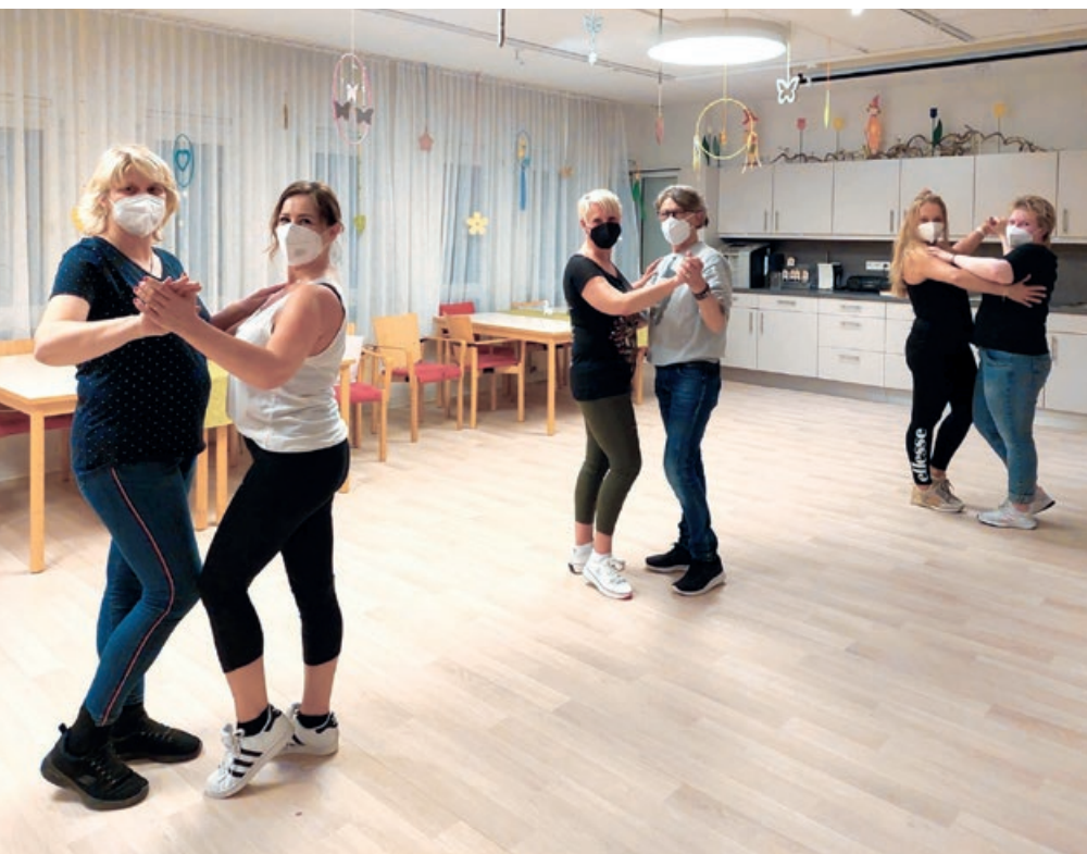
Mitarbeitende des Johanniter-Hauses in Rimbach beim Tanzkurs

Das psychobiografische Pflegemodell nach Böhm wird auch im Johanniter-Haus Weschnitztal in Rimbach angewendet. Mitarbeitende des Hauses besuchten dafür Fortbildungskurse. Dabei ging es insbesondere um die Gefühlsbiografie demenziell erkrankter Bewohner/-innen. Um sie wieder die Teilhabe am Leben spüren zu