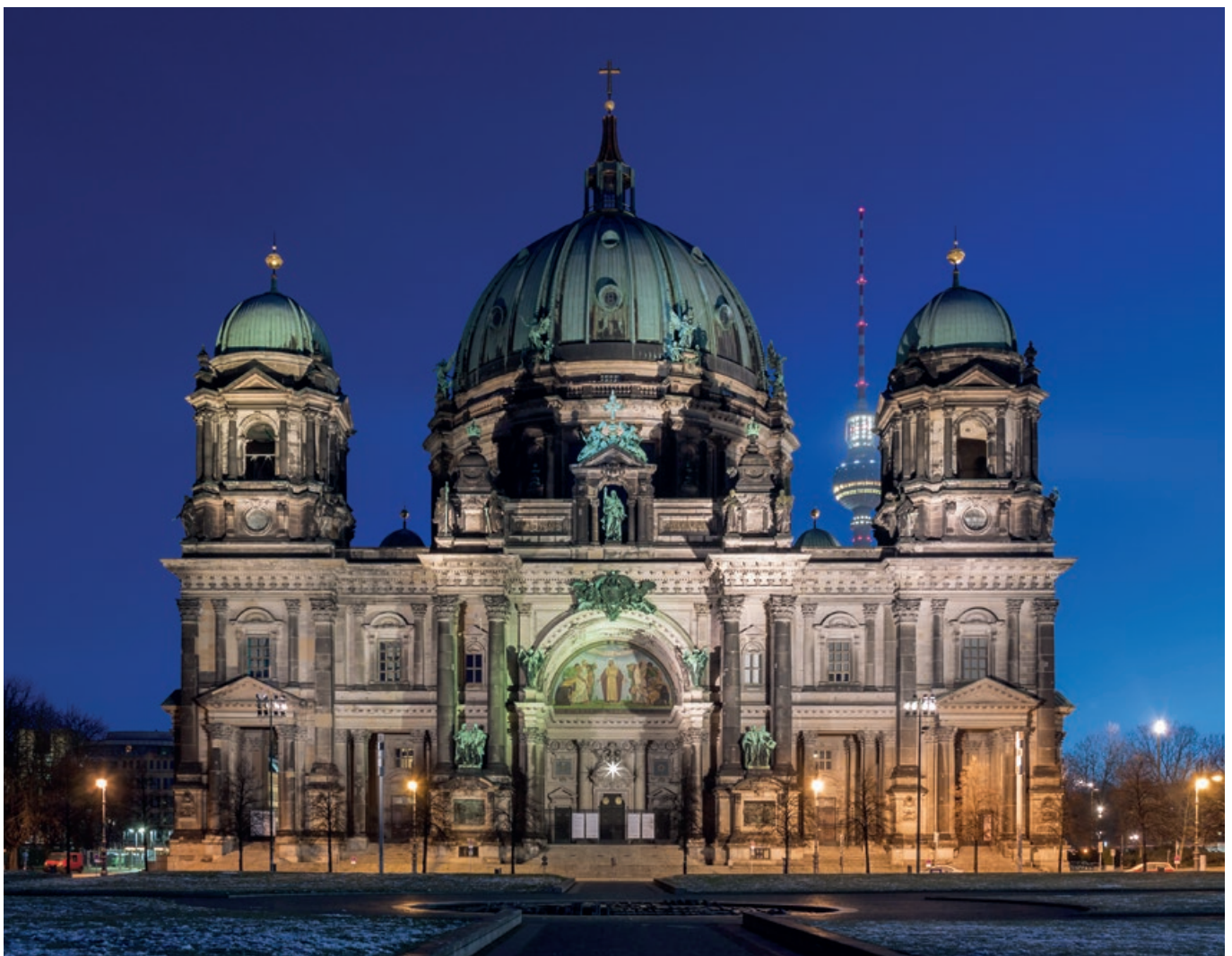
Westfassade des Berliner Doms

traut. Und auch das Angebot der sogenannten Funk-Schola im Berliner Kulturradio rbb zum Erlernen Gregorianischer Gesänge unter der Leitung von Heinrich Rumphorst wurde wahrgenommen. Daraus erwuchs schließlich der Mut, auch mit „musikalischen Laien“ die liturgischen Tageszeitengebete im Dom zu feiern. Das Domkirchenkollegium legte dafür alsbald als Datum den jeweils ersten Montag des Monats um 19.00 Uhr und als Ort den Chorraum am Petrusaltar fest. So konnte ab dem 6. Oktober 1997 zum ersten Mal die Vesper