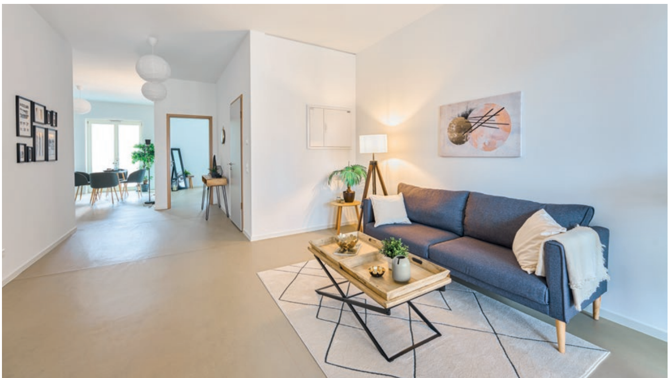
Blick in eine Musterwohnung im Erdgeschoss

Modernes Wohnen, wie konzeptionell durch das Mehrgenerationenwohnen dargestellt, findet sich in den AndreasGärten auch bauseitig wieder. Während das Erdgeschoss in klassischer Massivbauweise entstanden ist, sind die beiden Obergeschosse in Holzbauweise hergestellt. Vorteile hieraus sind vor allem die erhöhte Nachhaltigkeit, aber auch eine gesteigerte „Wohlfühlatmosphäre“, wie zahlreiche Interessierte und zukünftige Mietende bei den Be-