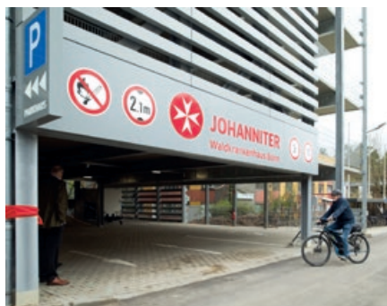
Im neuen Parkhaus des Waldkrankenhauses befinden sich zahlreiche Fahrradparkplätze für die Teilnehmenden an der Aktion „Johanniter goes green“.

der Räume oder dem Ausschalten der EDV-Anlagen nach Dienstende.“