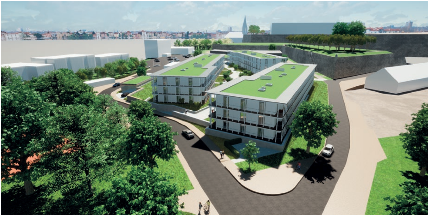
Alle Häuser des Mehrgenerationenprojektes AndreasGärten sind nach Stationen des Johanniterordens benannt: Rhodos, Malta und Akkon.

sichtigungen der Musterwohnung und den schon jetzt fertiggestellten Wohnungen gespiegelt haben. Dies liegt sicherlich vor allem an der sichtbaren, naturbelassenen Holzdecke im ersten und zweiten Obergeschoss der Mietwohnungen, aber auch an den in Holz hergestellten, stilprägenden Laubengängen, welche die Wohnkörper umrahmen.