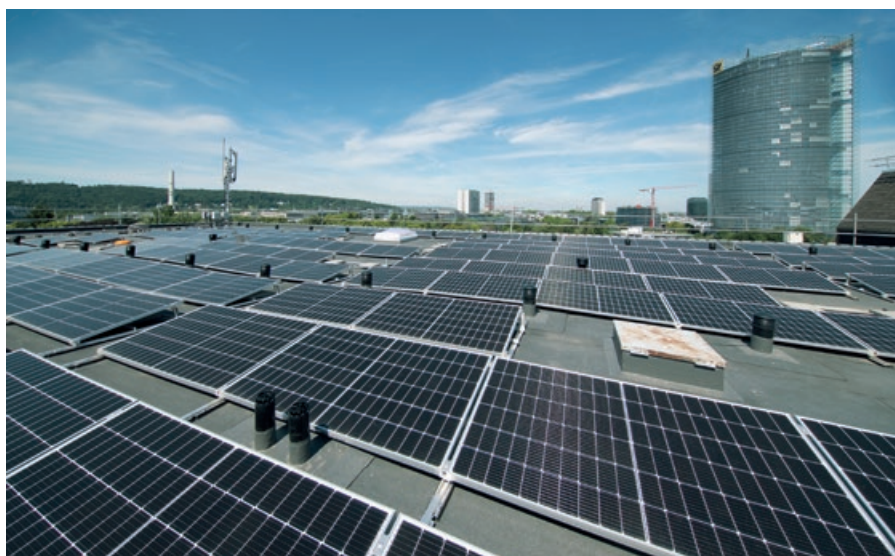
Solaranlage auf dem Dach des Johanniter-Krankenhauses in Bonn