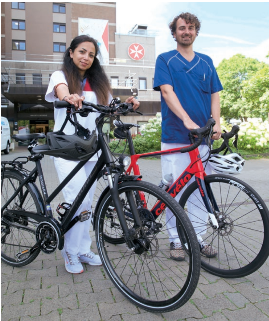
Mitarbeitende der Johanniter steigen um – mit dem Fahrrad zur Arbeit.