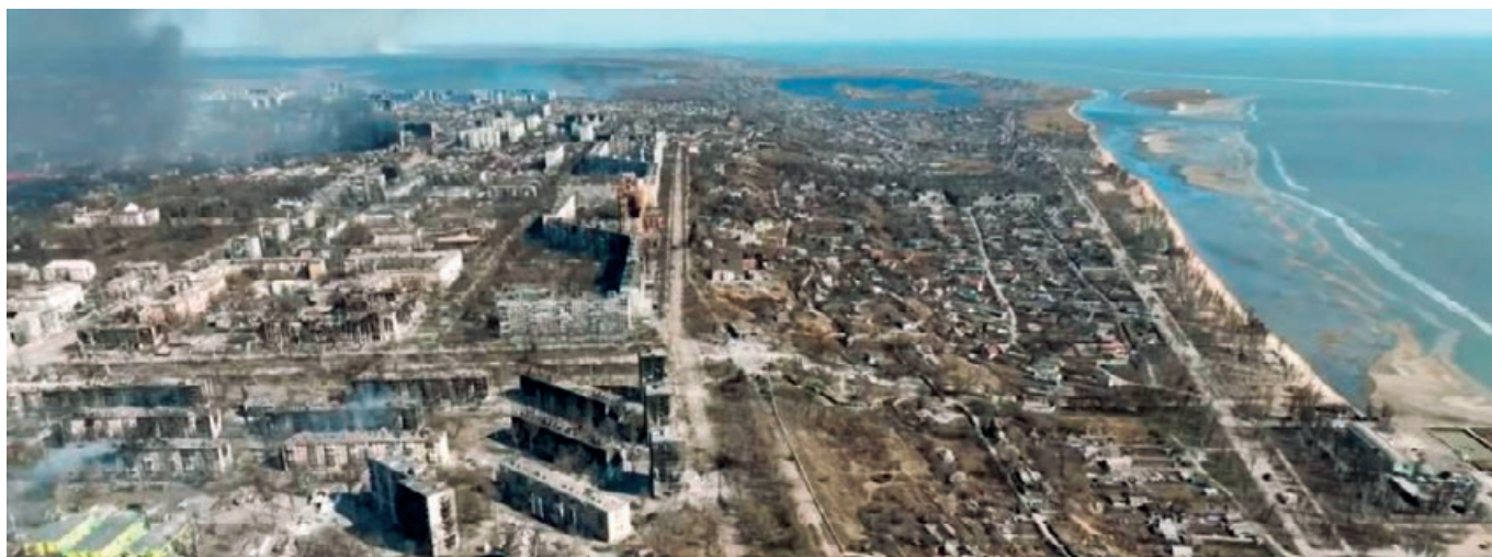
Mariupol ist aktuell 90 Prozent zerstört worden

Weitere Artikel sind im Intranet des Johanniterordens verfügbar.