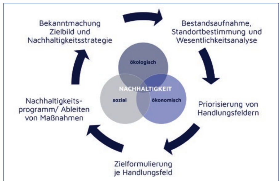
Prozess zur Entwicklung einer Nachhaltigkeitsstrategie für die Johanniter-Unfall-Hilfe (Grafik: ©Johanniter)

liegen unsere wichtigsten Handlungsfelder? Ein Beispiel ist die große Flotte an Fahrzeugen, die die Johanniter unterhalten, um