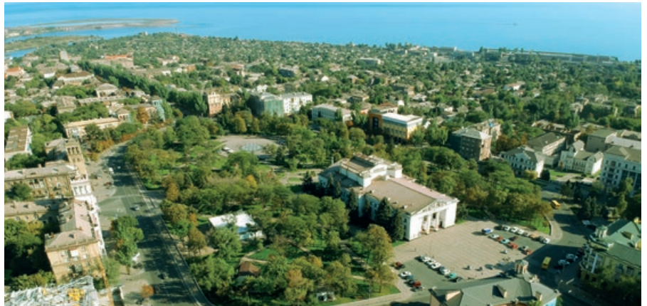
Mariupol vor dem russischen Angriffskrieg

In einem Pflegeheim in der Nähe von Odessa suchten Mitte März schwerst mehrfach gehandicapte Kinder und Jugendliche zusammen mit ihren Betreuenden im Keller Schutz vor dem dauerhaften Beschuss im Rahmen der russischen Angriffe. Mehr als vierzig Stunden verharren sie dort, nur