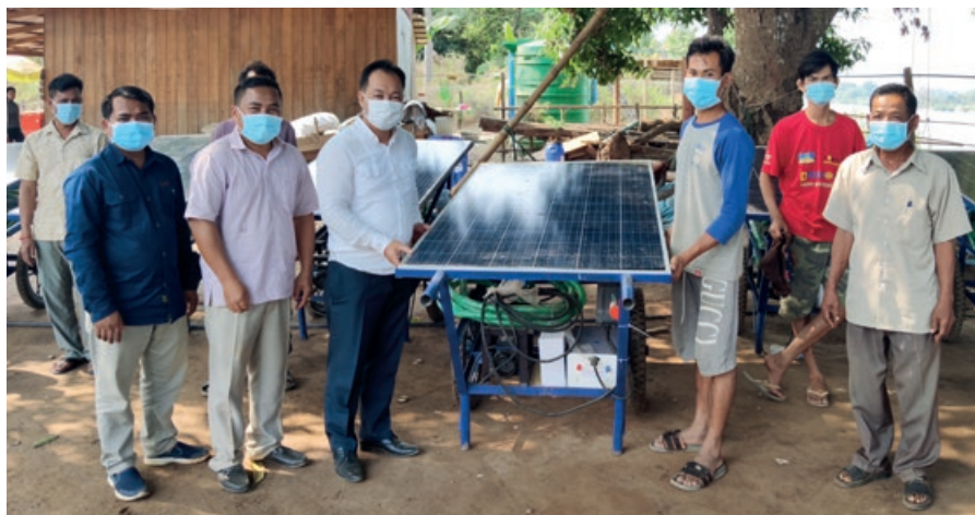
Solarbetriebene Pumpen erlauben das Wässern von Beeten und Feldern sowie das Speichern von Strom für Licht in der Nacht.

Als Akteur im Nothilfe- und Entwicklungssektor will auch die Johanniter-Auslandshilfe eine Antwort auf die komplexen globalen Herausforderungen und Entwicklungen geben, die durch die Auswirkungen des Klimawandels und