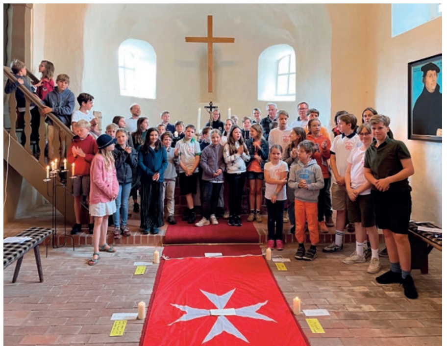
Nach der Andacht

G roßes Kinderstaunen in Jüterbog südlich von Berlin: Wer hätte gedacht, dass auf dem dortigen Fürstentag von 1611 fast der Dreißigjährige Krieg verhindert worden wäre? Das lernten jene mehr als 35 Mädchen und Jungen im Alter von 8 bis 14 Jahren, die im Juli zur siebten Brandenburger Johanniter-Kinderfreizeit zusammenkamen. Die mittelalterliche Stadt in Brandenburg unweit der sächsischen Landesgrenze bot den jungen Besuchern und ihren Betreuern bei ihrem Ausflug viele weitere Sehenswürdigkeiten, etwa einen der wenigen noch erhaltenen Ablasskästen des marktschreierischen Dominikanermönchs Johann Tetzl. Das Relikt, über das Theodor Fontane in seinen „Wanderungen durch die Mark Bran-