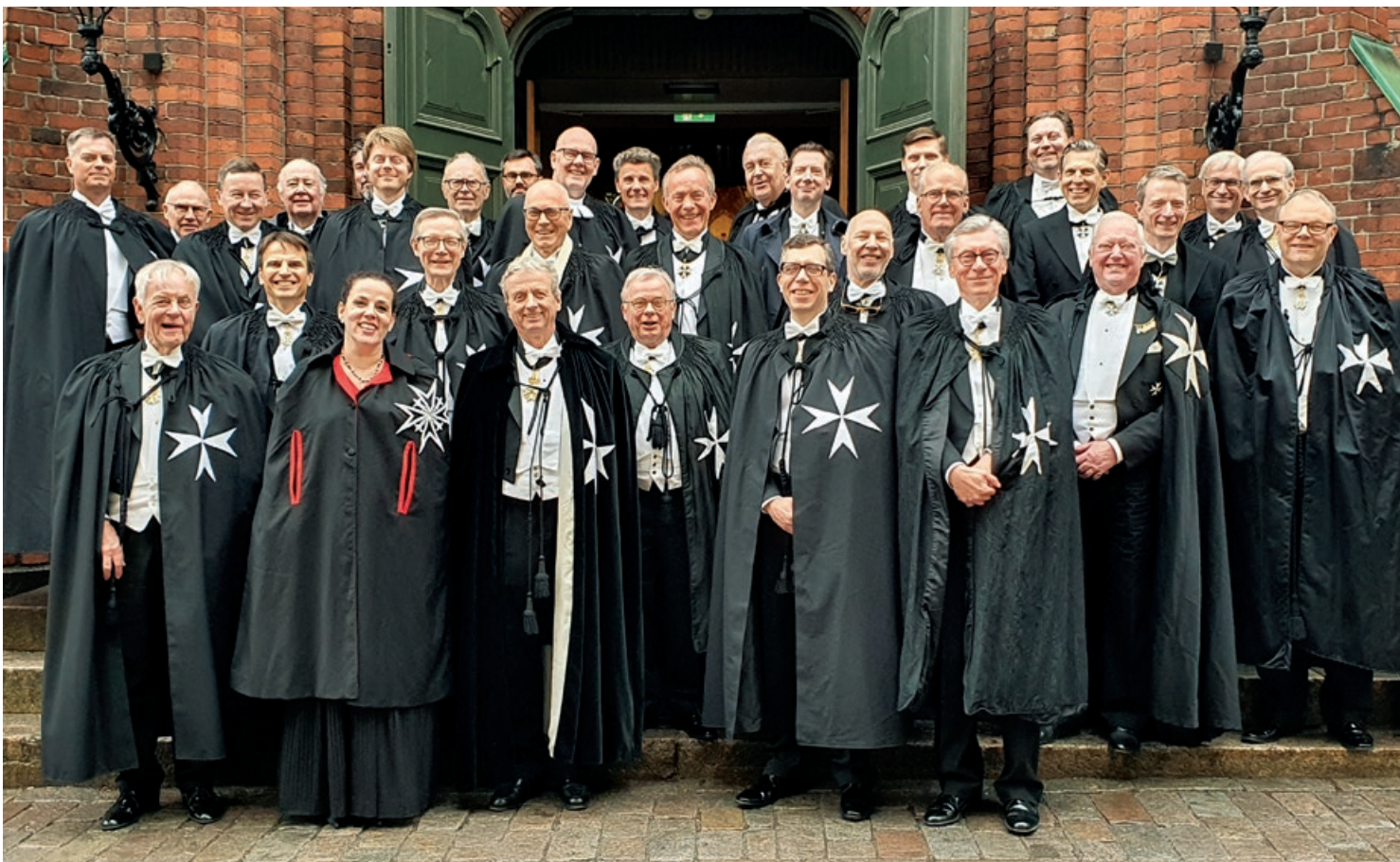
Teilnehmer vor der Deutschen Kirche